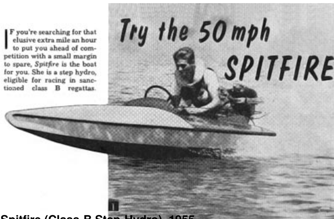
Spitfire (Class-B Step-Hydro), 1955